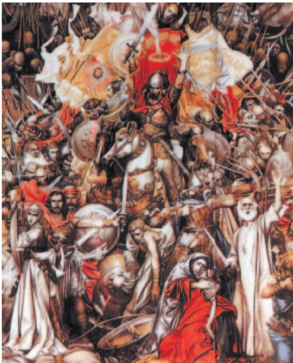
Григор Ханджян — Аварайрская битва.

Воины, павшие в битве при Аварайре, были причислены к лику святых Армянской Апостольской Церкви и именуются Св. Вардананк.