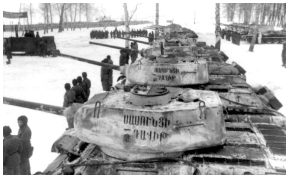
Танковая колонна Давид Сасунский (вклад армян в Победу).