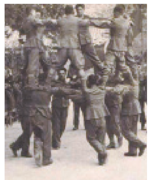
Победный танец «Кочари».