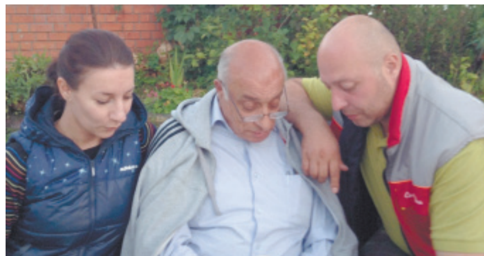
Два сына и внучка...

его рекомендациям по добавкам, получился регулируемым по объёмной массе, т.е. его можно было производить от суперлёгкого до конструкционного. Он оказался легче керамзита. Для производства нового материала по совету металлургов